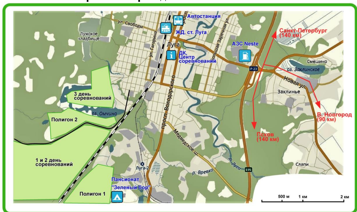
Схема районов проведения Чемпионата России

Районы закрыты для посещения спортсменами, тренерами, представителями команд до окончания Чемпионата России.