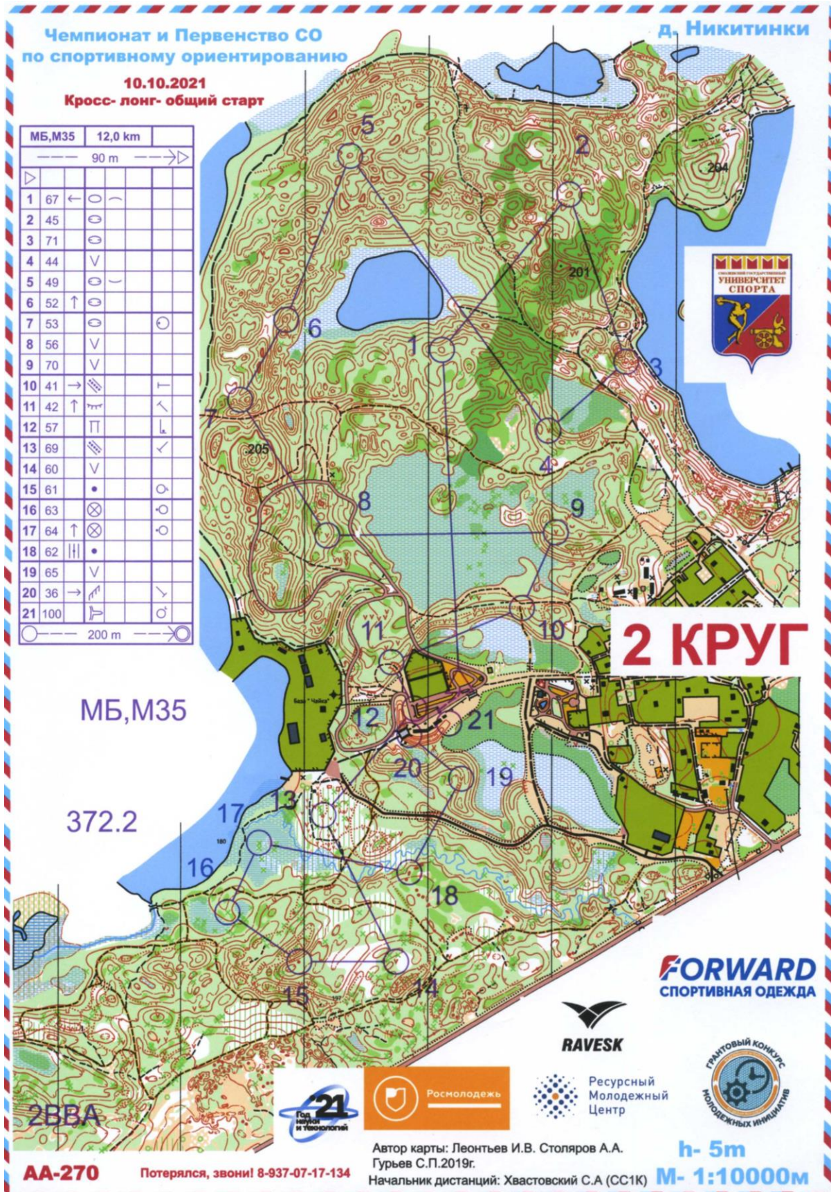
Рисунок 2 – Спортивная карта второго дня соревнований