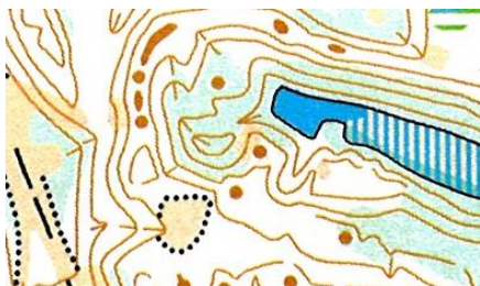
Фрагмент карты второго дня соревнований.