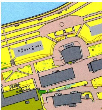
Фрагмент карты первого дня соревнований.