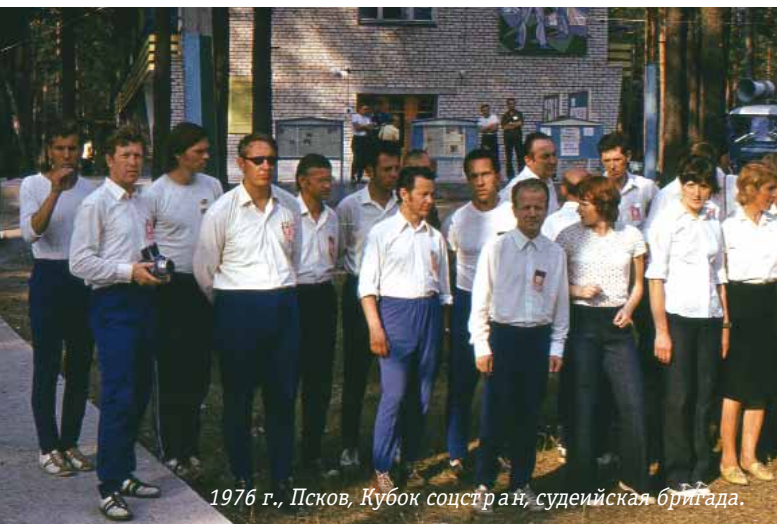
1976 г., Псков, Кубок соцстран, судейская бригада.