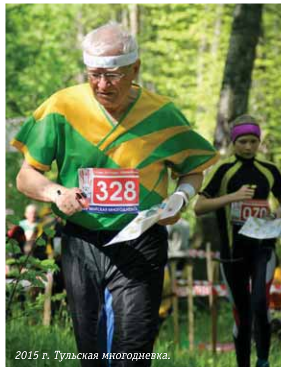
2015 г. Тульская многодневка.

И городские «Юбилейные» соревнования, на которых чествуют мастеров ориентирования Рязани – это тоже его проект, так же, как и «Введенские старты» – соревнования по спортивному ориентированию бегом по заснеженному грунту, где ежегодно проигрываются новые формы организации и проведения соревнований. С 2004 года проводится «Мемориал» – соревнования, пос-