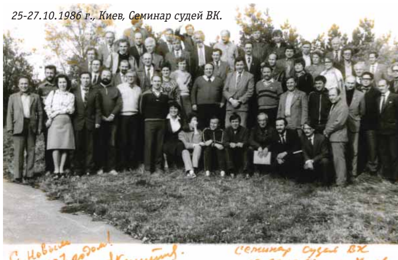
25-27.10.1986 г., Киев, Семинар судей ВК.