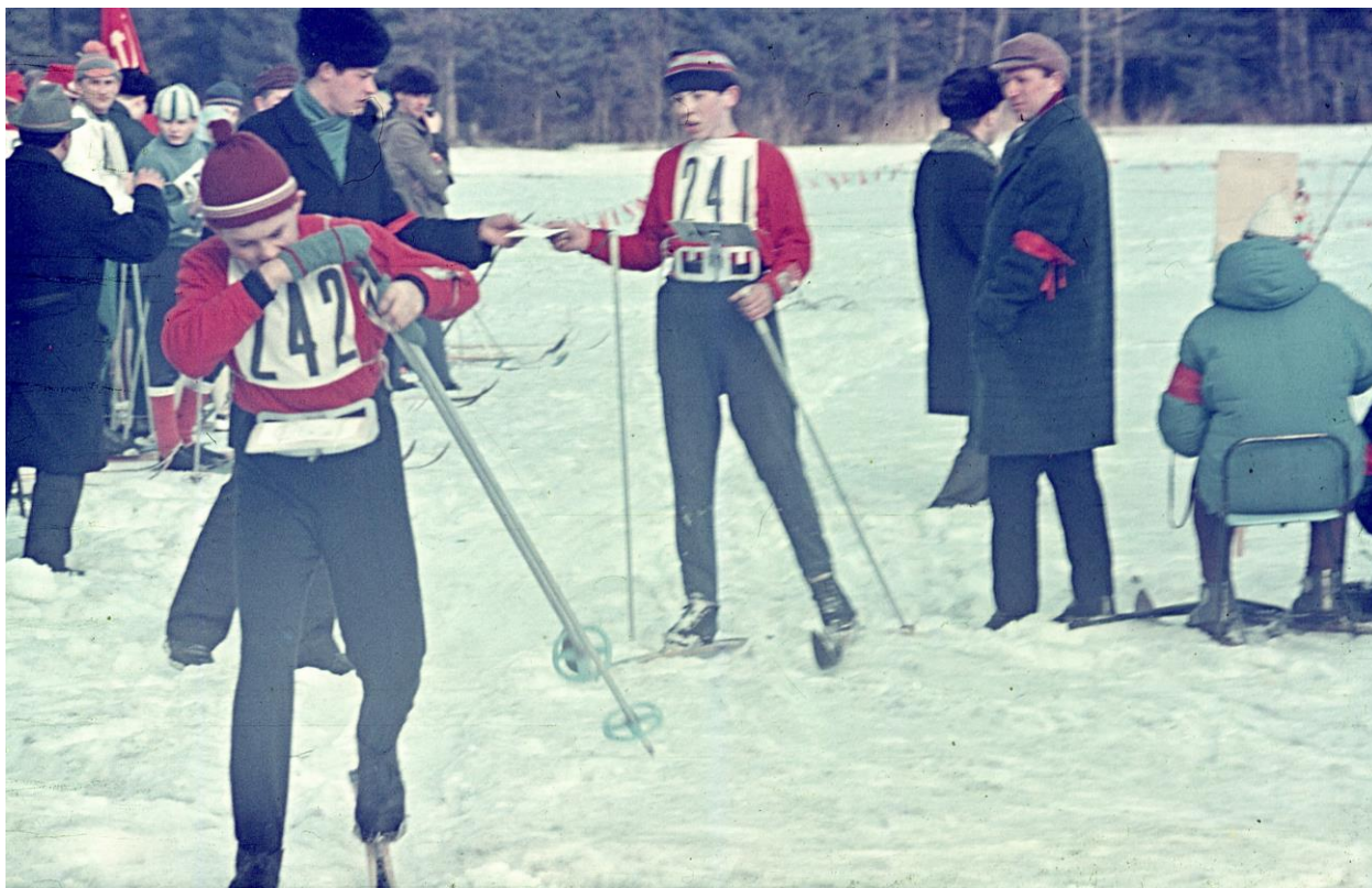
На старте, Пермь 1970

Эти команды – призёры зональных матчей и команды областей – организаторов соревнований получили право участвовать в финальном матче сильнейших команд РСФСР, который состоится с 23 по 28 марта 1970 г. в г. Перми и явится первым первенством РСФСР среди школьников по ориентированию на лыжах.