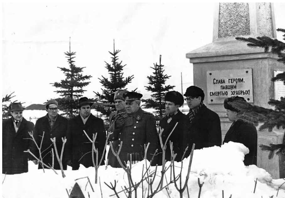
Митинг у памятника героям-панфиловцам

Из книги Е.И. Иванова «Дистанция длиною в жизнь»: