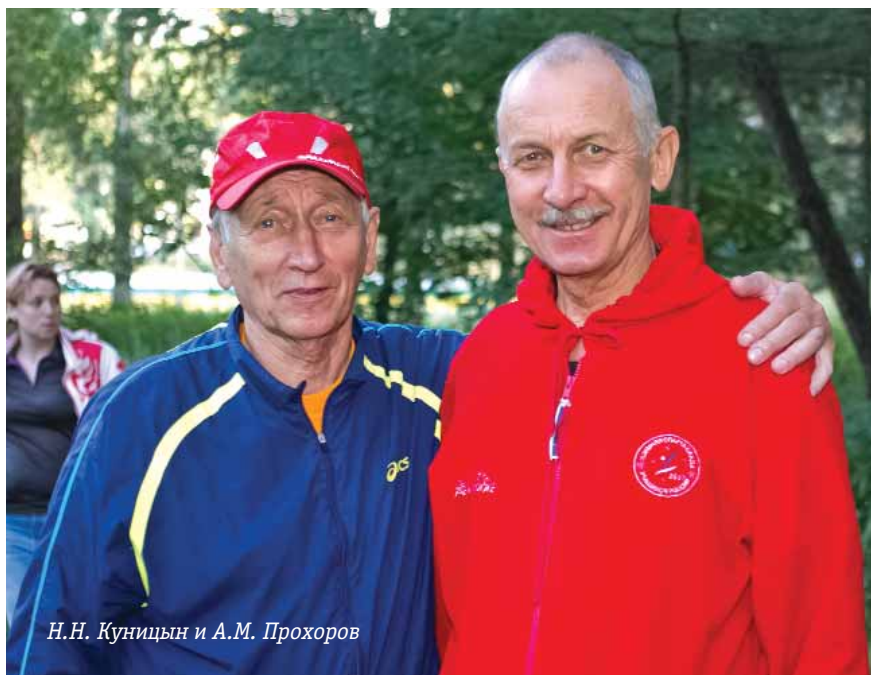
Н.Н. Куницын и А.М. Прохоров