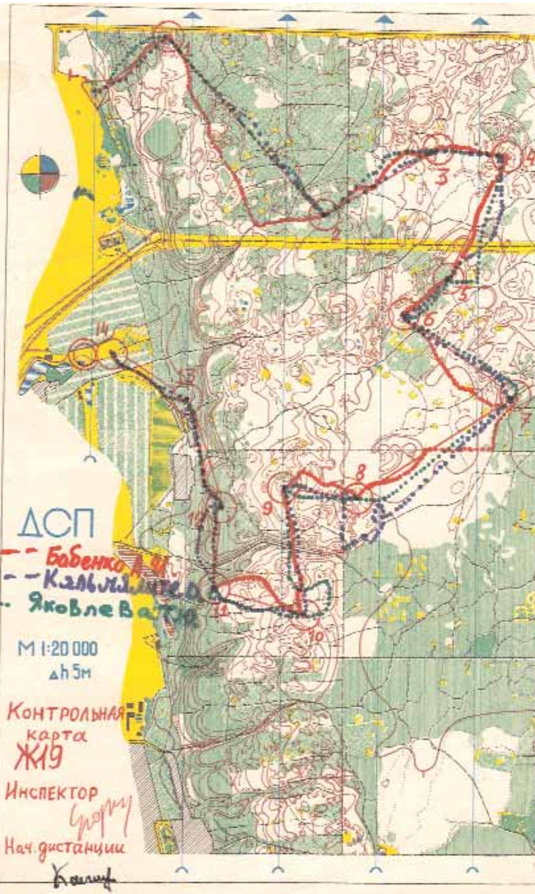
Карта с путями движения призеров второго дня соревнований (Боровое Матюшино)

заводили в "зеленку", насыщенную мелкими объектами. Такие этапы требовали умения жестко брать себя в узду и тормозить. Этапы, параллельные реке, проложенные вверх, требовали владения азимутальным бегом на склоне. А внизу, на параллельных реке этапах, проложенных вдоль террасы, загадки ставили овраги – форсировать напрямую или обходить? А если обходить, то