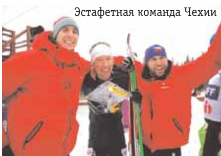
Эстафетная команда Чехии