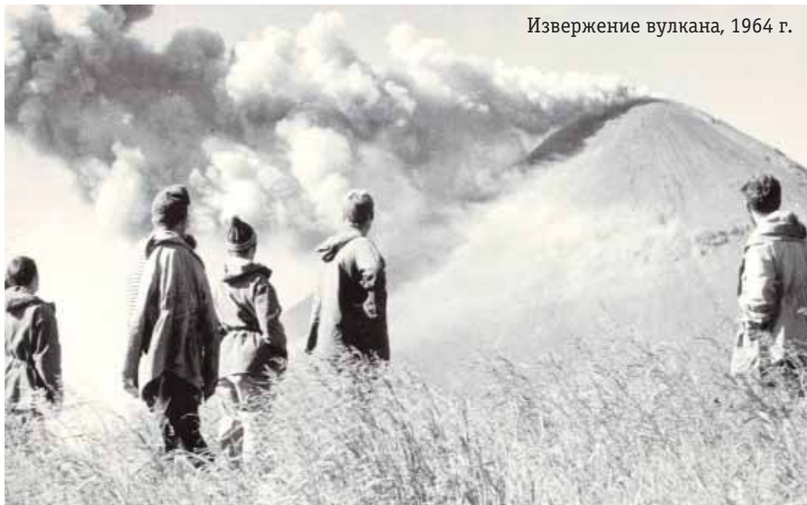
Извержение вулкана, 1964 г.

Первый – всегда первый. Это было более полувека тому назад, в 1963 году. Тогда спортивное ориентирование начинало брать свои первые азимуты, развивалось в ряде крупных регионов страны, и постепенно укрепилось мнение, что пора провести всесоюзные соревнования. Но существовало и немало скептиков, сомневающихся в возможности чёткой организации столь масштабного мероприятия «едва оперившимися птенцами».