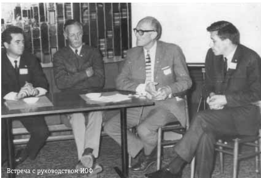
Встреча с руководством ИОФ