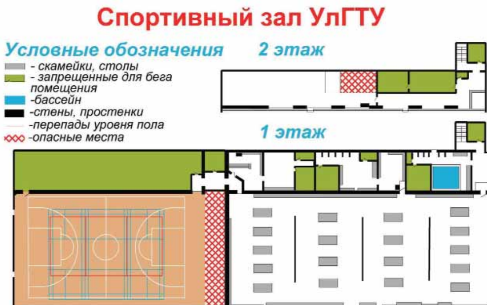
Рис. 2. Карта спортивных залов помещения УУлГТУ.

ного лабиринта обычно имеют масштаб 1:100 (в 1 см — 1 м) и не нуждаются в ориентировании по сторонам света (отсутствуют линии магнитного меридиана). В качестве искусственных ориенти-