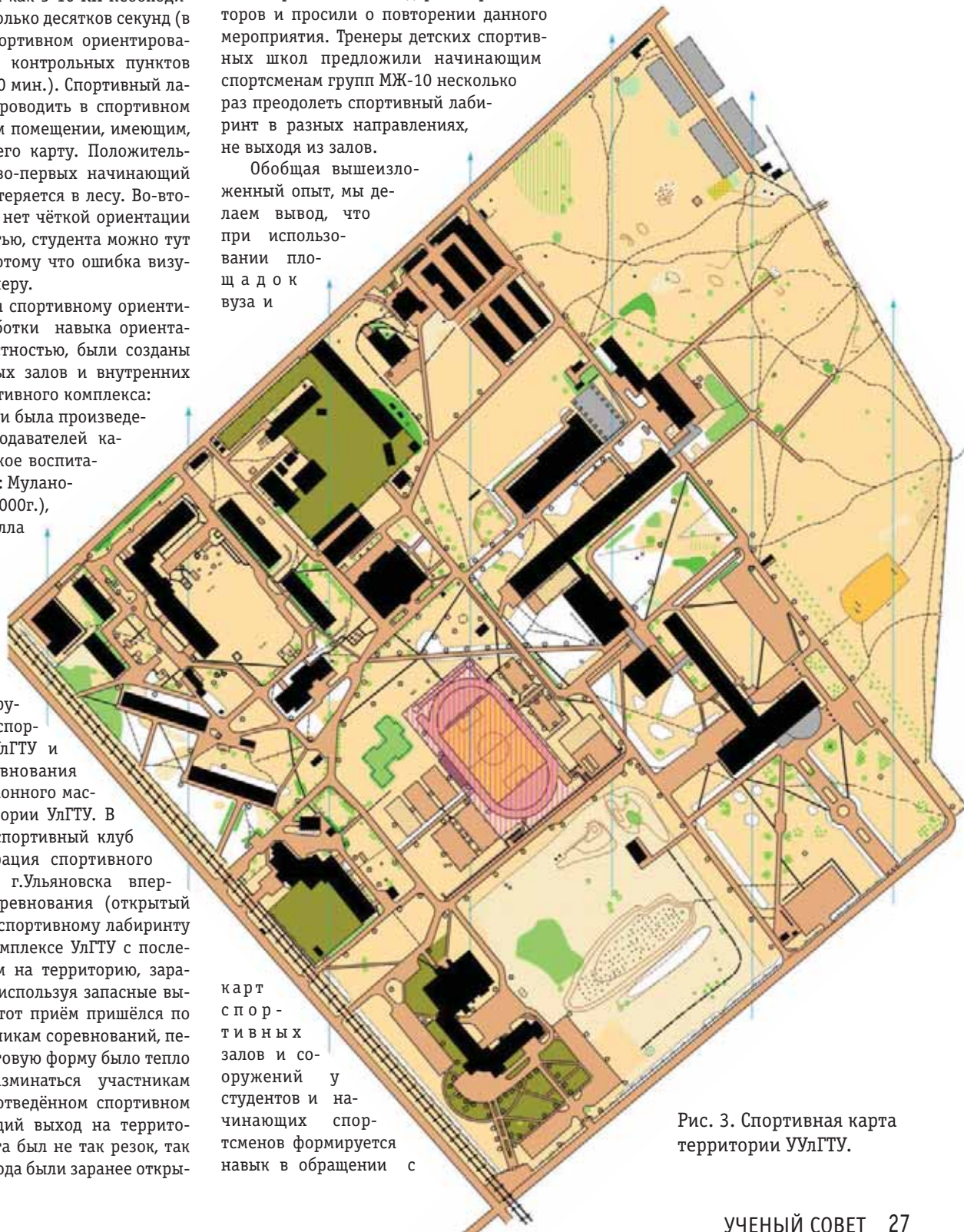
Рис. 3. Спортивная карта территории УУлГТУ.