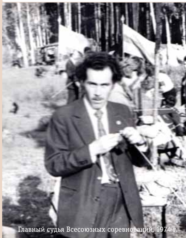
Главный судья Всесоюзных соревнований, 1974 г.

ровича в больницу, а на второй ступени крыльца у него остановилось сердце.