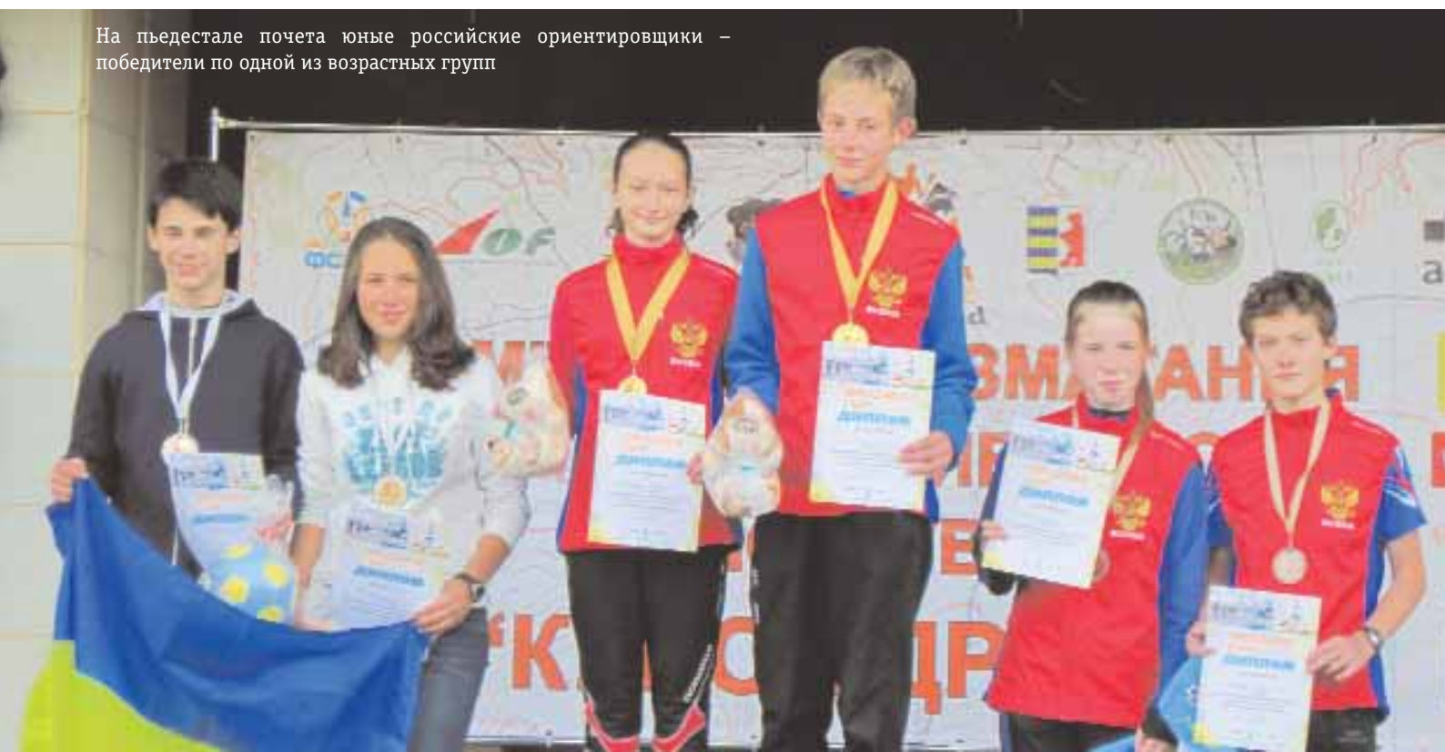
На пьедестале почета юные российские ориентировщики – победители по одной из возрастных групп

В рамках Кубка Дружбы проводился традиционный матч учащихся России и Украины. От России в матче принимали участие более 60 юных спортсменов, которые выступали в двух возрастных группах. Для них в первый день проводились эстафеты. Несмотря на то, что большинство юных россиян прибыли рано ут-