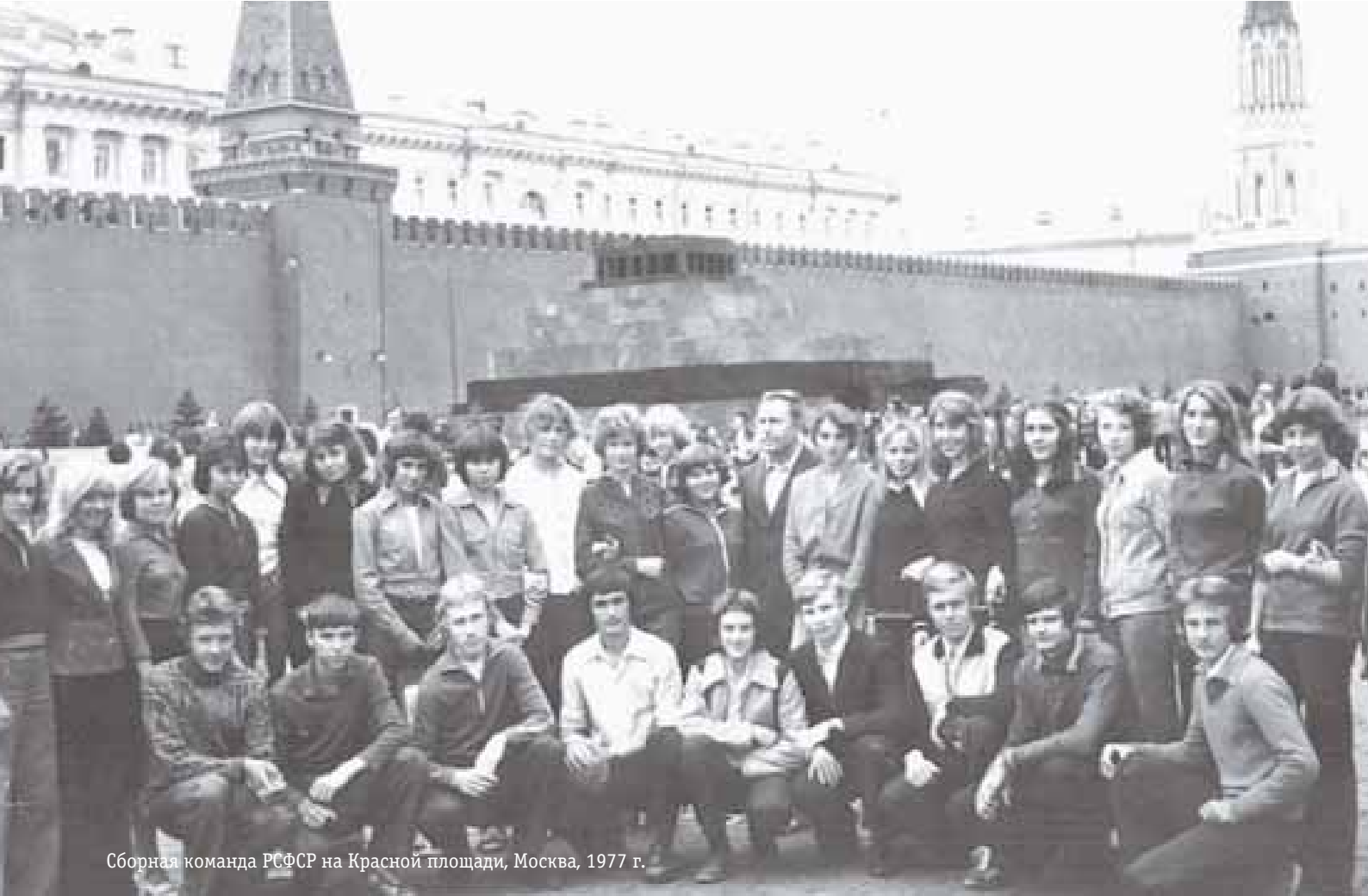
Сборная команда РСФСР на Красной площади, Москва, 1977 г.