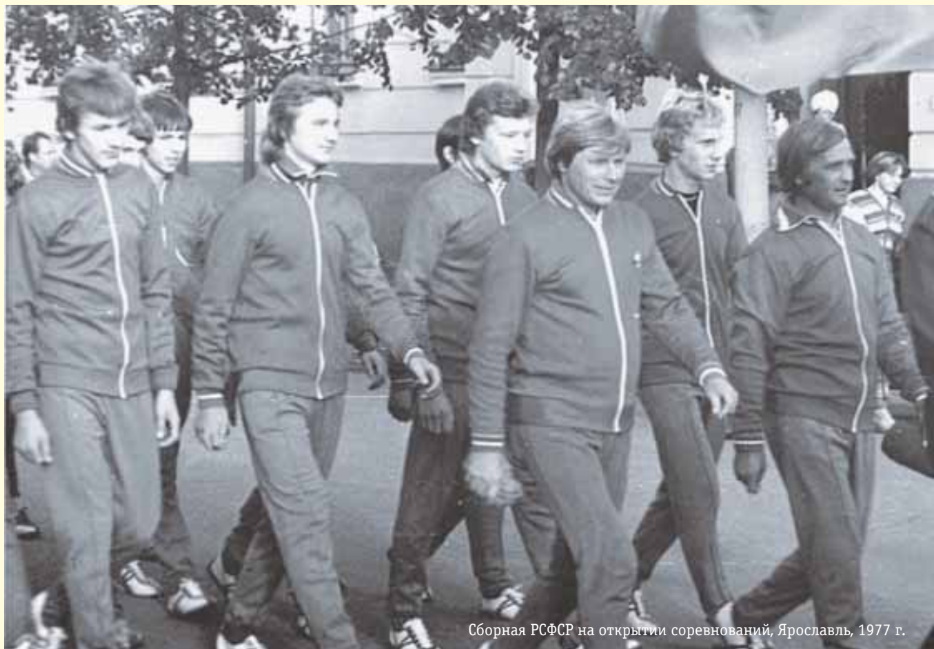
Сборная РСФСР на открытии соревнований, Ярославль, 1977 г.