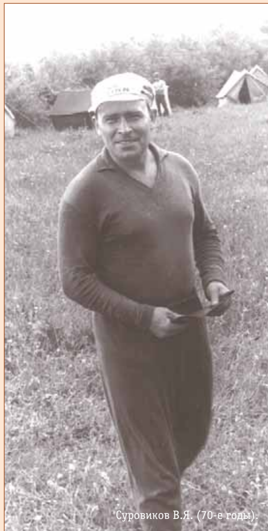
Суриков В.Я. (70-е годы).