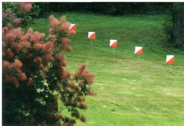
Вид на КП 15 с точки принятия решения, которая находится на асфальтовой дороге севернее КП, немного правее линии, соединяющей КП 15 и 16.

Цифры 1, 2, 3 внесены для понимания решения.