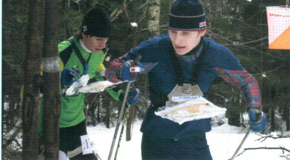
Первенство среди учащихся 2008. Дистанция заданного направления Ж20, М18