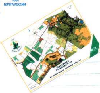
Ettapp 1 Orust.