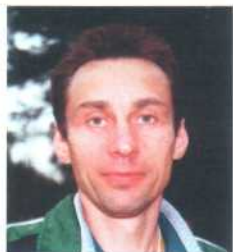
Кобзев Юрий главный судья соревнований, мастер спорта СССР, СРК

Павловск — районный городок юга Воронежской области, расположенный на левом берегу Дона, в среднем его течении.