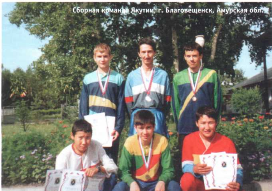
Сборная команда Якутии, г. Благовещенск, Амурская обл.

Потом мы переехали в Хабаровск на Кубок России (Азиатская часть) для взрослых и