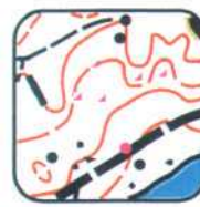
1 - E4