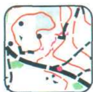
1 - E2