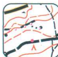
1 - E3