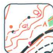
1 - E5