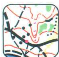
1 - E1