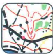
1 - E1

ТРЕЙЛ-О можно использовать на тренировках со здоровыми детьми как начальное, безопасное и в то же время точное ориентирование, о прохождении сложных элитных трасс Т-О будет интересно и для спортсменов высокого класса.