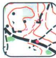
1 - E2