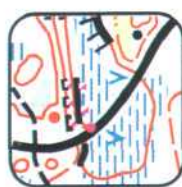
1 - E10

“Правильная призма”, находящаяся в центре окружности и соответствующая легенде, должна устанавливаться с максимальной точностью.