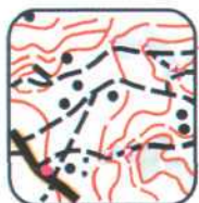
1 - E7