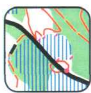
1 - E9