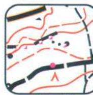
1 - E3