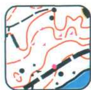
1 - E4