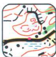
1 - E8