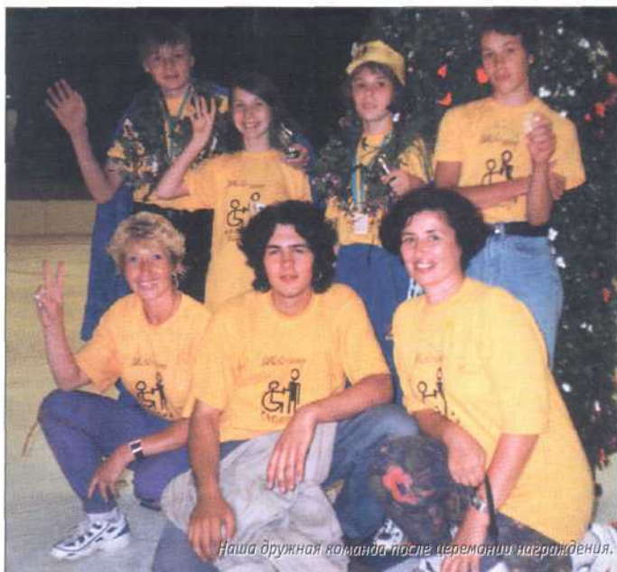
Наша дружная команда после церемонии награждения.