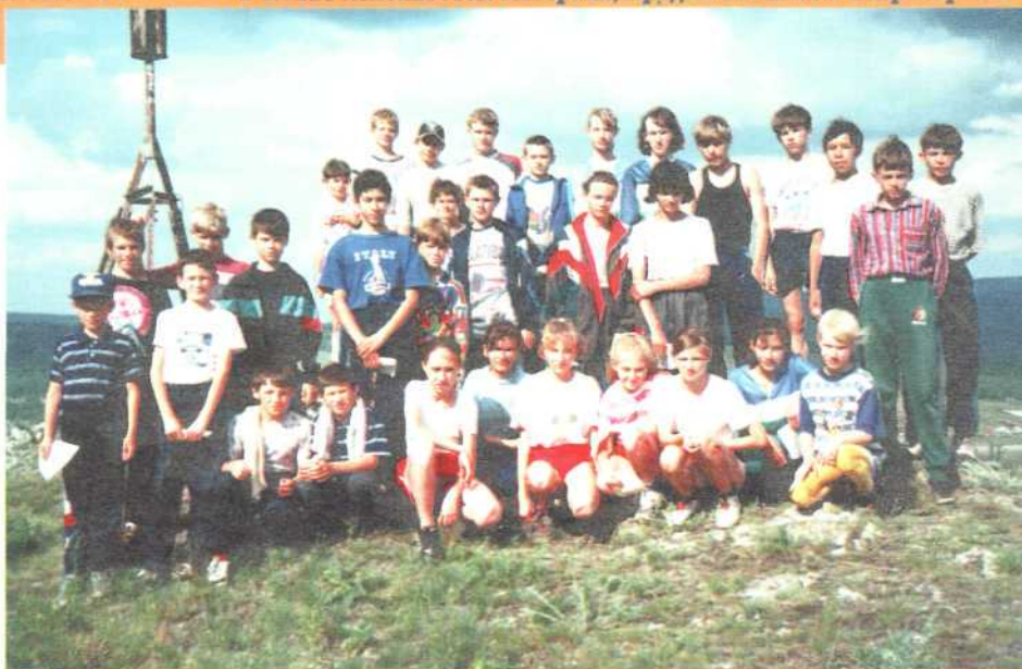
На сборе в Ново-Абзаково