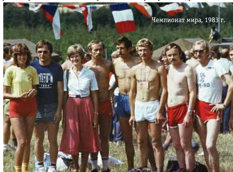
Чемпионат мира, 1983 г.