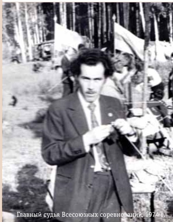
Главный судья Всесоюзных соревнований, 1974 г.

ровича в больницу, а на второй ступени крыльца у него остановилось сердце.