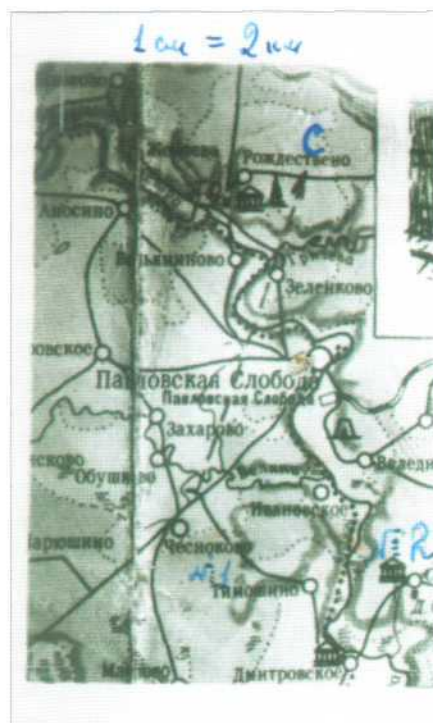
Пояснения к карте Первенства ИАЭ 4 октября 1959 года.

Но как найти счастливого обладателя такого чуда? И решится ли таковой дать сфотографировать сокровище? Пока ничего не получалось. Какой-то выход появился в конце 1958 года: в продаже появилась серия карт – 2-х-километровок на популярные у туристов районы Подмосковья. На од-