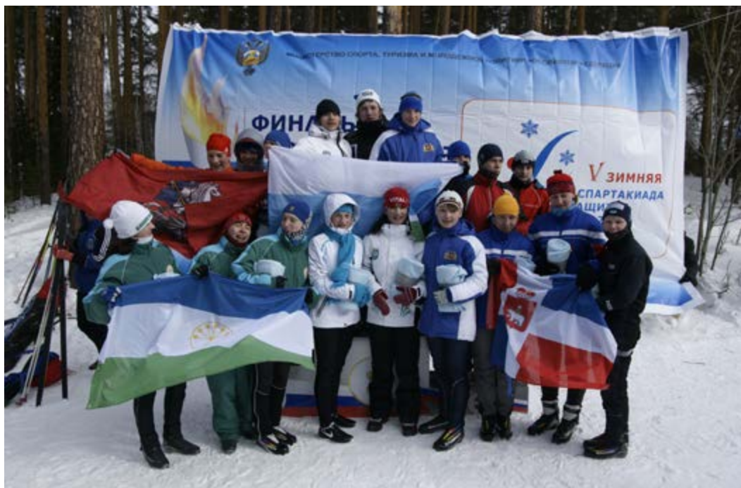
Зимняя Спартакиада учащихся 2011 года

В последние годы развитие ориентирования идет не только вглубь, но и вширь. Возникают и становятся самостоятельными новые виды ориентирования. В 1997 году в Москве параллельно чемпионату России было проведено первенство России по велоориентированию в группах МЖ 16,18. Позже первенства России по ориентированию на велосипеде стали проводить и по группам МЖ 14. Ряд детских коллективов, таких как московские «Ориента» и «Малахит», обзавелись велосипедами. В первом даже сформировалась даже отдельная команда «Ориента-вело», сосредоточившая свое внимание именно на велоориентировании.