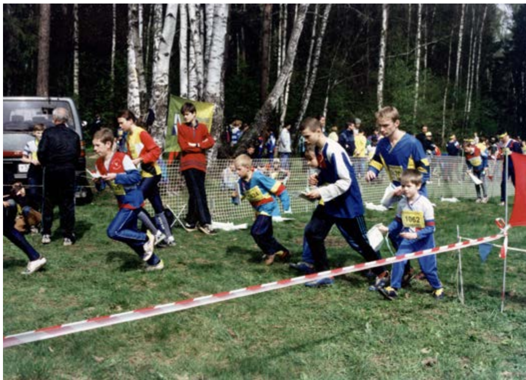
На старте массовых соревнований

Центральный регион открывает летний сезон на «Московском компасе» – одной из наиболее массовых многодневков страны, собирающей до двух тысяч человек. Традиционным для этих соревнований стал старт семейных групп, когда родители с малышами проходят корот-