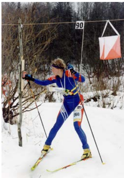
На КП с электронной отметкой

В 2000 году в Калининградской области на юношеском первенстве Европы впервые в России была использована электронная отметка. Через год чипы начинают применять на крупнейших российских соревнованиях вначале в элите,