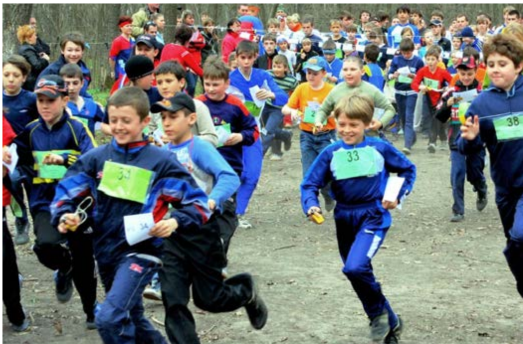
Забег в группе М-14

чали сладкие призы, а победители потом еще и отдельно награждались.