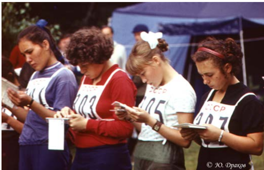
На старте 1 Всесоюзных соревнований среди пионеров и школьников, г. Вильнюс, 1974 г.

го календаря, появлению новых центров развития ориентирования. Традиционными и очень популярными становятся матчевые встречи республик Прибалтики, матч 10-ти сильнейших команд школьников РСФСР, матчевая встреча городов с миллионным населением и другие, которые проводятся по нескольким возрастным группам, что позволяет расти спортивному мастерству юных ориентировщиков.