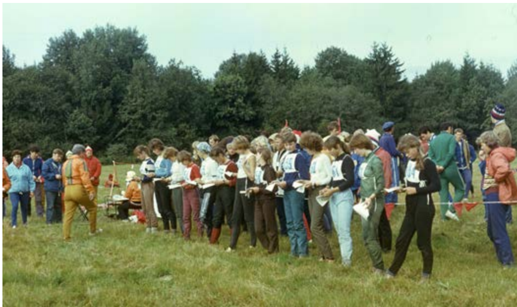
Матчевая встреча сильнейших команд на Кубок ЦК ВЛКСМ, 1984 г.

ния рассматривалось как вид спорта массовый, общедоступный, – экономический, политический, идеологический кризис, в котором наша страна оказалась в начале 1990-х, не мог не отразиться и на нем. Родители были озабочены тем, как одеть, обусть и накормить ребенка. На то, чтобы водить детей в кружки и секции у многих не оставалось ни сил, ни времени. Да и сами спортивные клубы без государственной финансовой поддержки оказались в тяжелом положении. И надо отдать должное работникам системы образования, детским тренерам, которые практически только на энтузиазме проводили бесплатные занятия в клубах, секциях и школах спортивного ориентирования. Несмотря ни на что продолжали проводиться городские и областные соревнования, а также многодневки, на которые приезжали спортсмены со всей страны, как взрослые, так и дети. До сих пор остаются популярными такие многодневки, как «Белые ночи»,