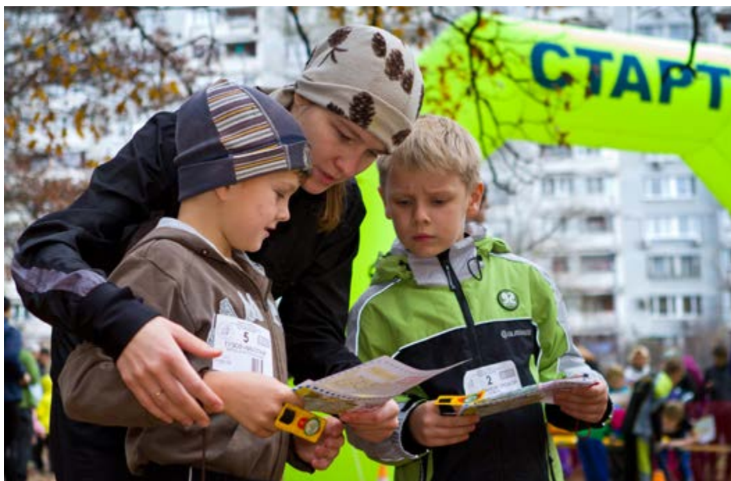
На соревнованиях в городском парке.

Отчетно-выборная конференция ФСО России, прошедшая в Нижнем Новгороде 22 декабря 1995 года, стала новым этапом в развитии детского ориентирования, в повышении мастерства юных спортсменов. На ней был взят курс на централизацию подготовки кандидатов