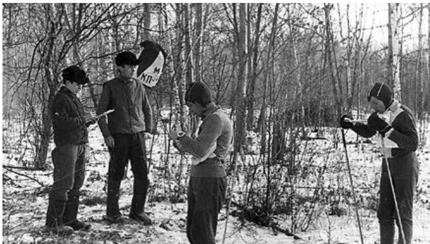
Ориентирование на маркированной трассе. 1960-е гг.

ников Москвы выезжала на зимнее первенство Ленинграда, а после на первенстве столицы сама принимала юных ориентировщиков Ленинграда и Латвии. Соревнования того времени показывали, что уровень подготовки карт и дистанций, уровень самой подготовки команд школьников в регионах был очень разный, в то время когда во взрослом ориентировании эти различия уже сглаживались.