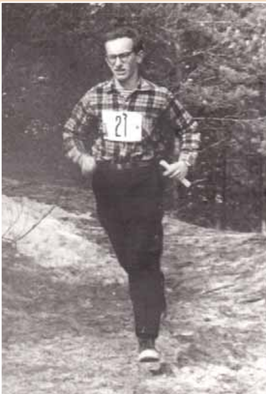
1965 г. Выступление на Первенстве Латвии по ориентированию среди школьников.