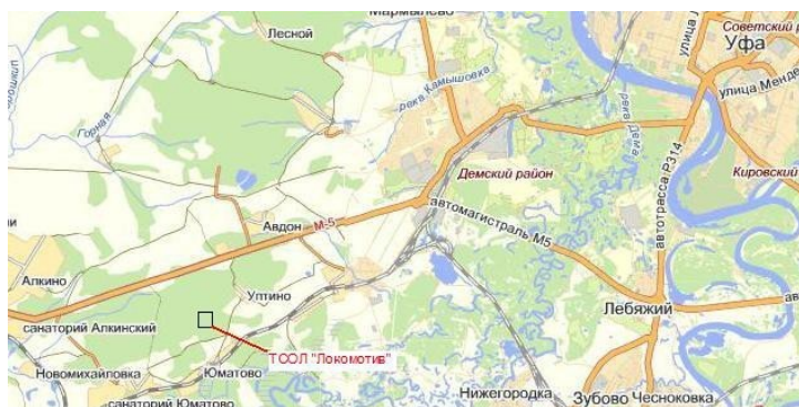
Схема для самостоятельного проезда:

Подъезд авто транспортом с Севера, Востока и Юга республики – по магистрали М 5, далее – поворот на д. Уптино, далее – на сан. «Юматово», далее – по разметке в ДТСОЛ «Локомотив». Подъезд с Запада республики – по магистрали М 5, далее поворот на сан. «Юматово», далее – на п. Юматово, далее – по разметке в ДТСОЛ «Локомотив».